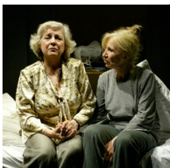
Divadelné predstavenie „S mamou“

Vychádzali sme z telefonického mediálneho auditu zameraného na názory novinárov o prekážkach širšieho pokrytia témy Alzheimerovej choroby v médiách. Mali sme tiež k dispozícii prieskum, ktorý v marci 2009 realizovala medzi psychiatrami a neurológmi spoločnosť TNS, podľa ktorého sa na prvé diagnostické vyšetrenie k neurológovi dostane v skorom štádiu ochorenia iba 36 % pacientov ,